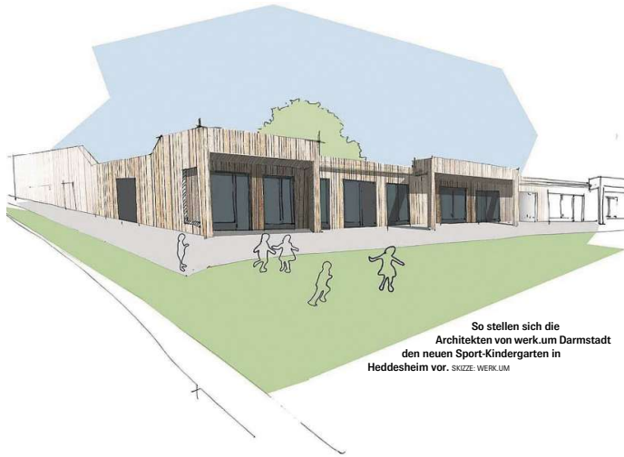
So stellen sich die Architekten von werk.um Darmstadt den neuen Sport-Kindergarten in Heddesheim vor.