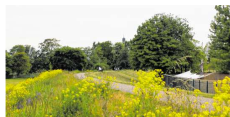
Der Hochwasserdamm in Ilvesheim.